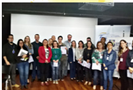
Assembleia dos trabalhadores do SESC Londrina