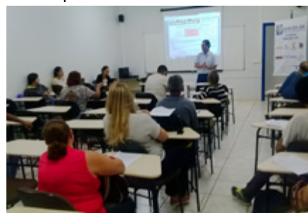
Assembleia com os trabalhadores do Provopar - Londrina