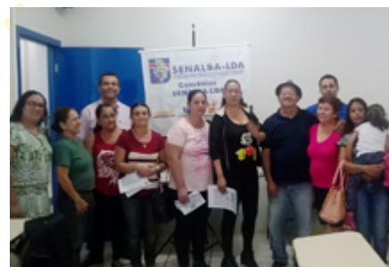
Assembleia com os trabalhadores das associações de Londrina