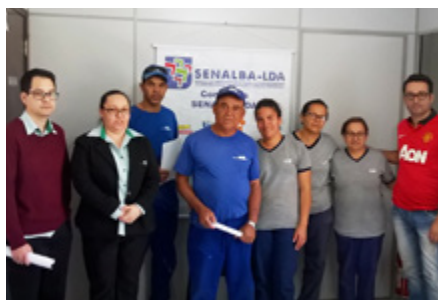
Assembleia com os trabalhadores do Londrina Country Club - Londrina