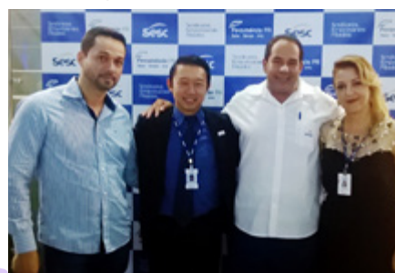
Inauguração do SESC/SENAC Norte