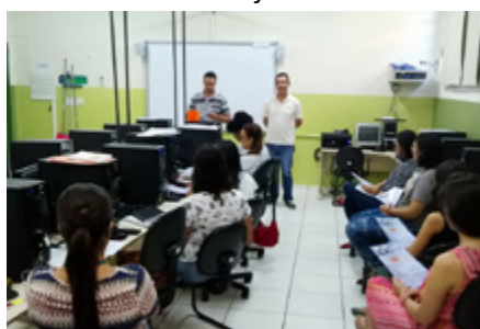
Assembleia com os trabalhadores da Guarda Mirim de Londrina