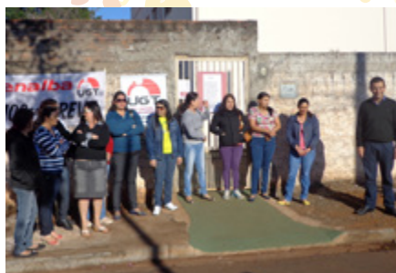
Paralisação de trabalhadores por atraso de pagamento em entidade filantrópica