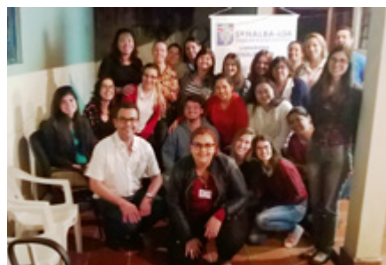
Assembleia com os trabalhadores da Cáritas Assistência Social